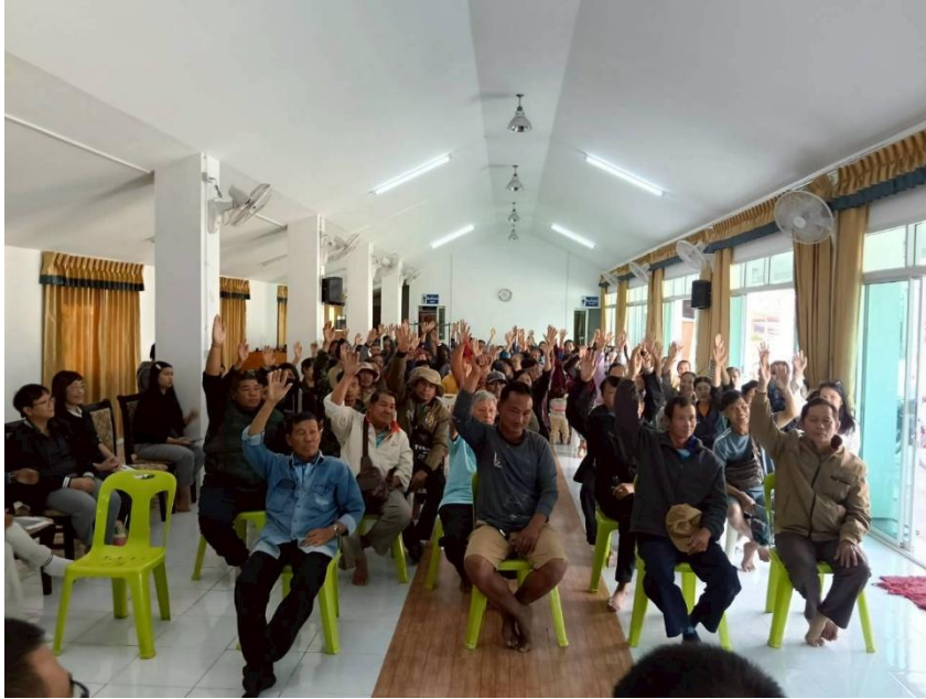
วันที่ ๓ กุมภาพันธ์ ๒๕๖๙ เวลา ๐๙.๐๐ - ๑๒.๐๐ น. หมู่ ๑ บ้านหนองพ้าง ตำบลโป่งน้ำร้อน